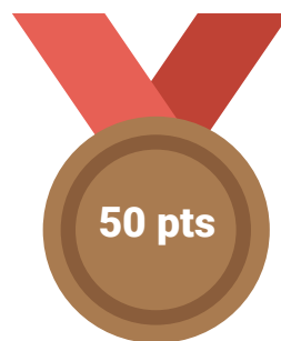
Palettes de bronze