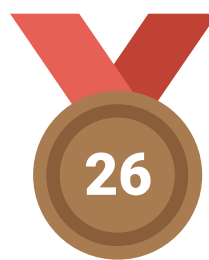
Palettes de bronze